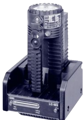
HE 8 N EN с зарядным устройством LG 483